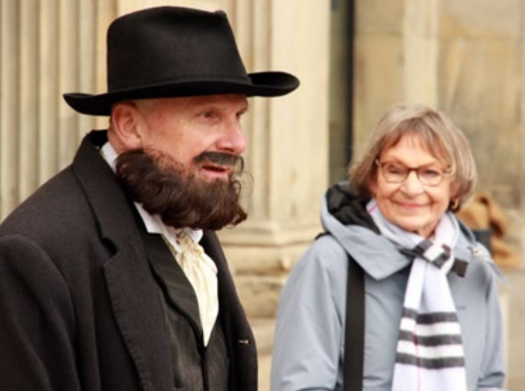
Eins-Zwei-Drei im Sauseschritt