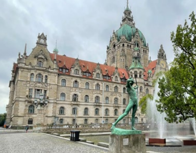
Das Neue Rathaus und seine Nachbarn